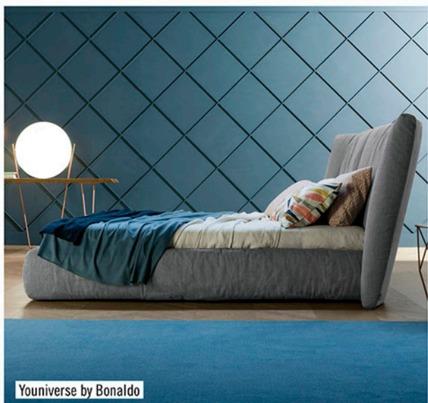
Youniverse by Bonaldo