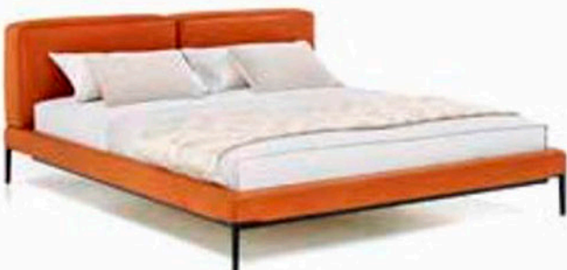
Joyce Cushion Bed by Wittmann